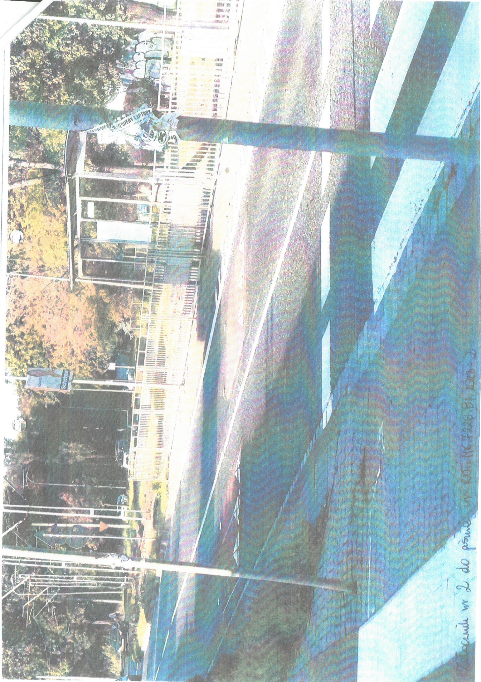
Rotacunda nr 2 do přímě v 2011. 7.2016. 81. 1020 - 2