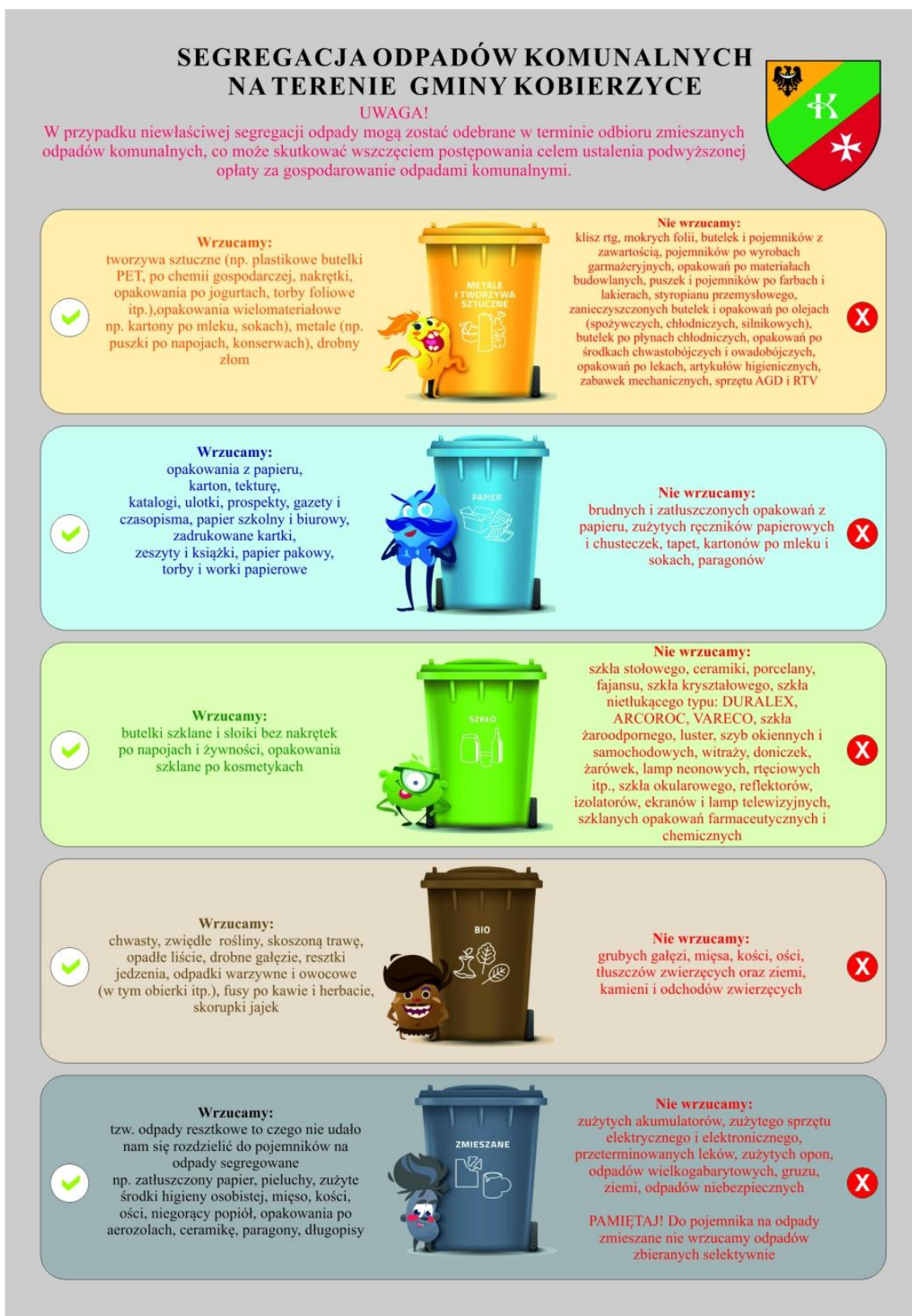
Rysunek 4.1 Schemat systemu gospodarowania odpadami komunalnymi obowiązujący w analizowanym 2022 r. (ulotka - Urzędu Gminy Kobierzyce)